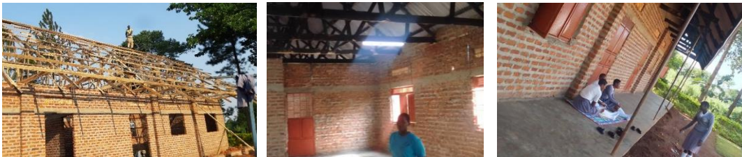
Bouw nieuwe slaapzaal. Ruwbouw is klaar. Ramen en deuren. Nu nog binnenaafwerking.