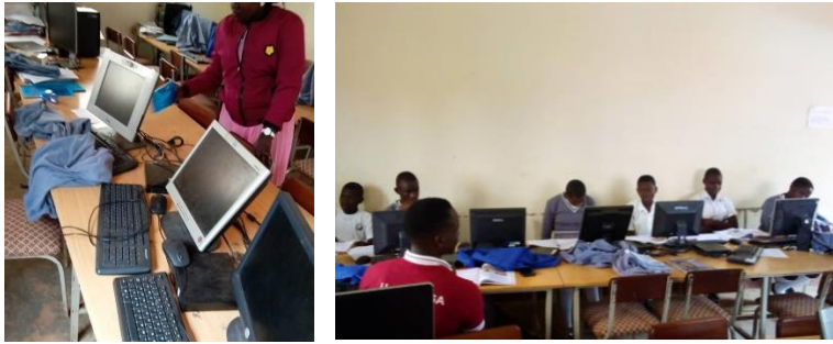
Aankoop nieuwe laptops.